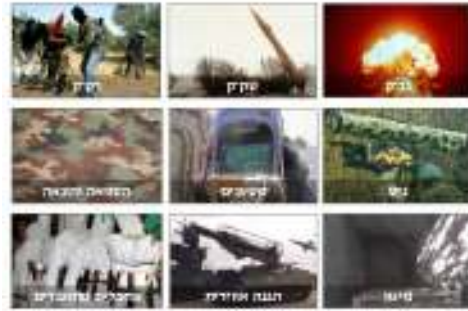
דפוסי פעולה טקטיים

זה כבר הוזכר קודם ואפילו גנבו ממני את הדוגמאות אבל הנגזרת, היותר אופרטיבית של העניין הזה, זה תפיסה אסטרטגית, איך מנצחים כשמגיעים לשדה הקרב? הרעיון הזה שאנחנו קראנו לו מזווית ראייה ישראלית 'ניצחון באמצעות אי הפסד' ואפשר לראות פה בדיבור של נסראללה שהוא מחובר היטב לחשיבה של הצד השני, 'ניצחון' אומר נסראללה 'מבחינתנו הוא שההתנגדות תיותר על כנה, שלא תישבר רוחה, שלבנון לא תוכנע ותשמור על כבודה' זה טקסט מלקראת סיום מלחמת לבנון השנייה 'העובדה שנשארנו עומדים עד היום היא בחזקת ניצחון, העובדה שספגנו את המכה היא הניצחון והעובדה שהמשכנו במאבק היא הניצחון'.